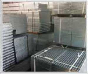
Gallerdurk från lager